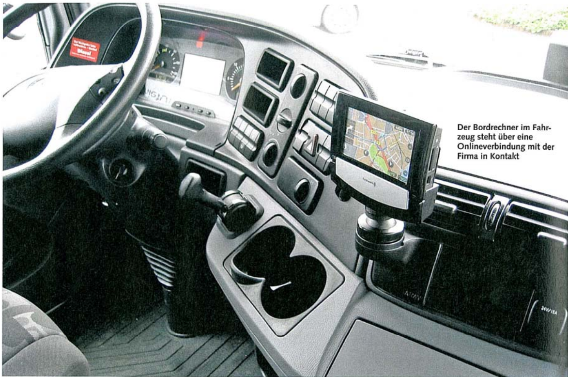
Der Bordrechner im Fahrzeug steht über eine Onlineverbindung mit der Firma in Kontakt

Durch bessere Organisation und Einsatzplanung Geld sparen